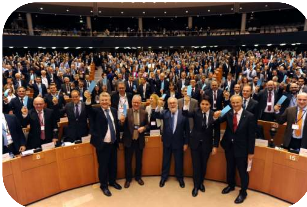
Parlamentul European, Ceremonia Convenției Primarilor 2015